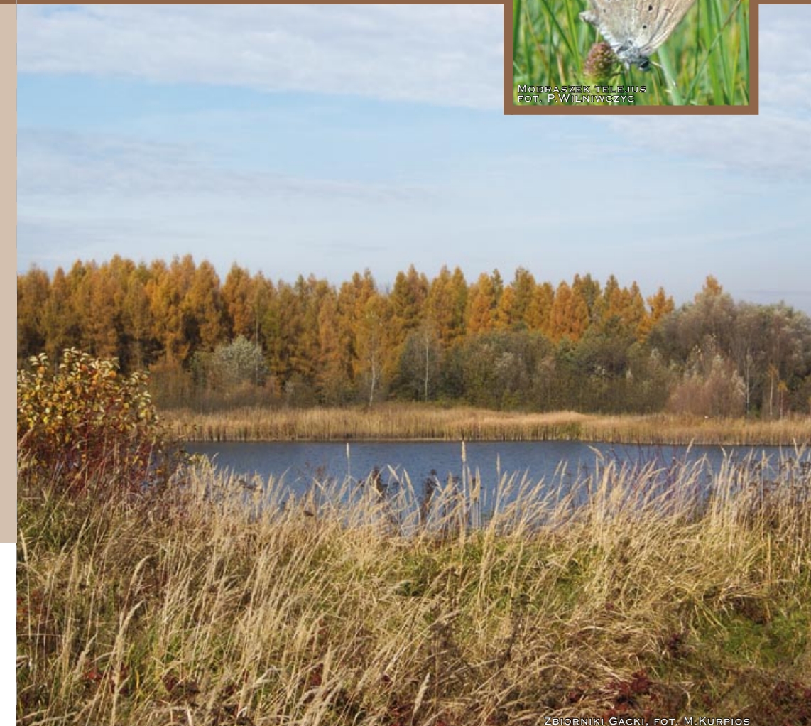
ZBIORNIKI GACKI