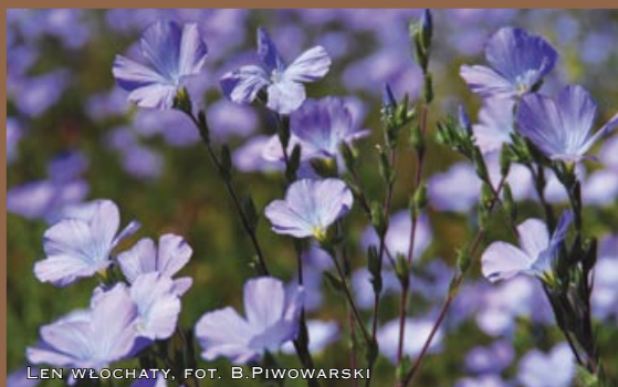
LEN WŁOCHATY