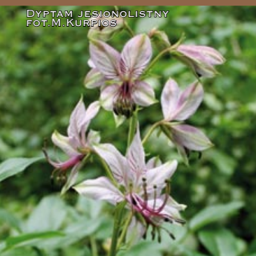
DYPTAM JESIONOLISTNY