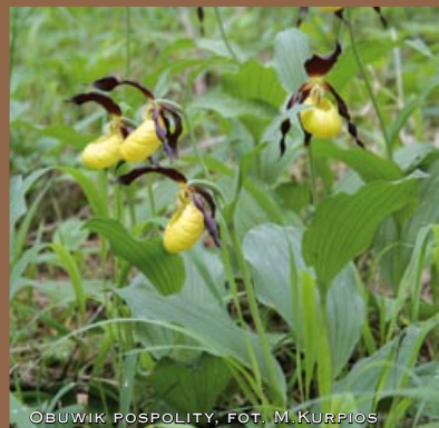
OBUWIK POSPOLITY