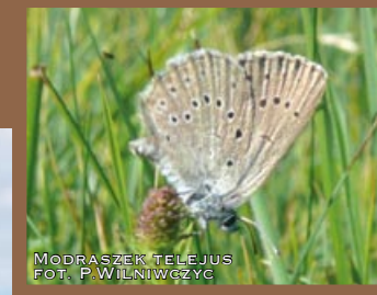
MODRASZEK TELEJUS, FOT. P. WILNIWGCZYC