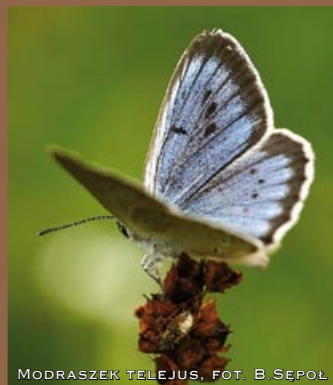
MODRASZEK TELEJUS