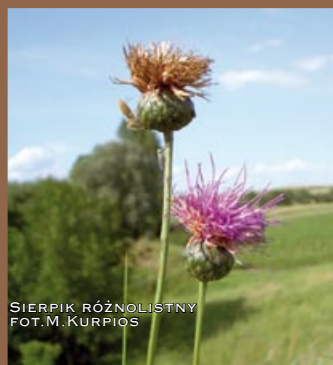
SIERPIEK RÓŻNOLISTNY