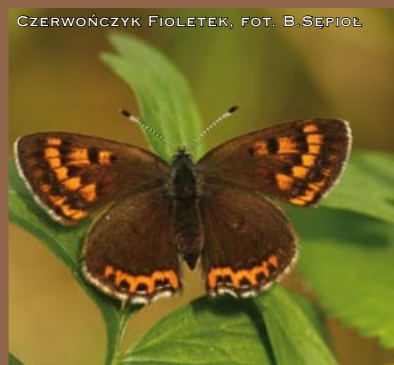
CZERWOŃCZYK FIOLETEK

REGIONALNY DYREKTOR OCHRONY ŚRODOWISKA JEST ORGANEM ADMINISTRACJI RZĄDOWEJ ZAJMUJĄCYM SIĘ OCHRONĄ ŚRODOWISKA ORAZ OCHRONĄ PRZYRODY. WYKONUJE SVOJE ZADANIA NA PODSTAWIE USTAWY Z DNIA 3 PAŹDZIERNIKA 2008 R. O UDOSTĘPNIANIU INFORMACJI O ŚRODOWISKU I JEGO OCHRONIE, UDZIALE SPOŁECZEŃSTWA W OCHRONIE ŚRODOWISKA ORAZ O OCENACH ODDZIAŁYWANIA NA ŚRODOWISKO (Dz. U. NR 199, POZ. 1227 ZE ZM) PRZY POMOCY REGIONALNEJ DYREKCJI OCHRONY ŚRODOWISKA.