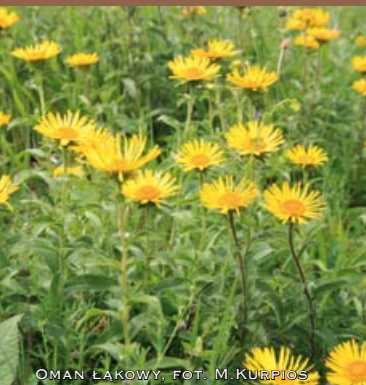
OMAN ŁĄKOWY, FOT. M. KURPIOS

ZNAJDUJE SIĘ TU JEDYNE W POLSCE STANOWISKO SIERPIKA RÓŻNOLISTNEGO ORAZ JEDNA Z NAJMOCNIEJSZYCH POPULACJI DZIEWIĘCSIŁA POPŁOCHOLISTNEGO. DOLINKI POMIĘDZY WZGÓRZAMI ZAJĘTE SĄ PRZEZ ZBIOROWISKA ŁĄKOWE. WYSTĘPUJĄCE TUTAJ ZBIOROWISKA LEŚNE TO PRZED E WSZYSTKIM LASY ŚWIEŻE Z FRAGMENTAMI SIEDLISK BOROWYCH I OLSOWYCH. NA OBSZARZE ZLOKALIZOWANE SĄ TAKŻE DWA DUŻE KOMPLEKSY STAWÓW RYBNYCH, BĘDĄCE OSTOJĄ WIELU GATUNKÓW PTAKÓW. W OSTOI WYSTĘPUJE TAKŻE BOGATA FAUNA BEZKRĘGOWCÓW M. IN. NATUROWE GATUNKI MOTYLI – MODRASZEK TELEJUS I CZERWOŃCZYK FIOLETEK.